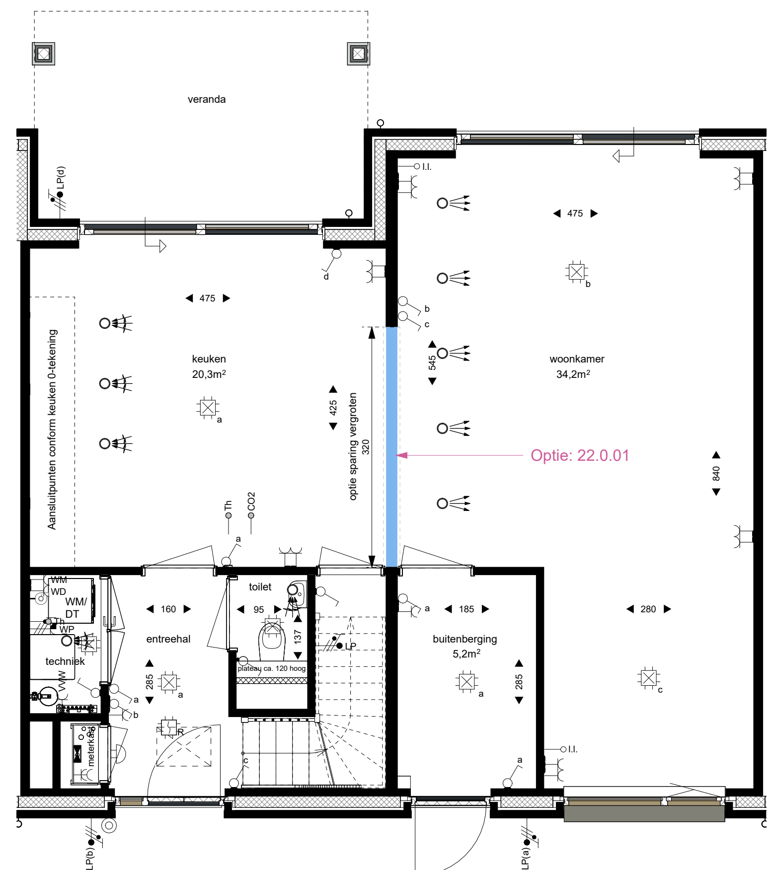
begane grond optiemogelijkheden