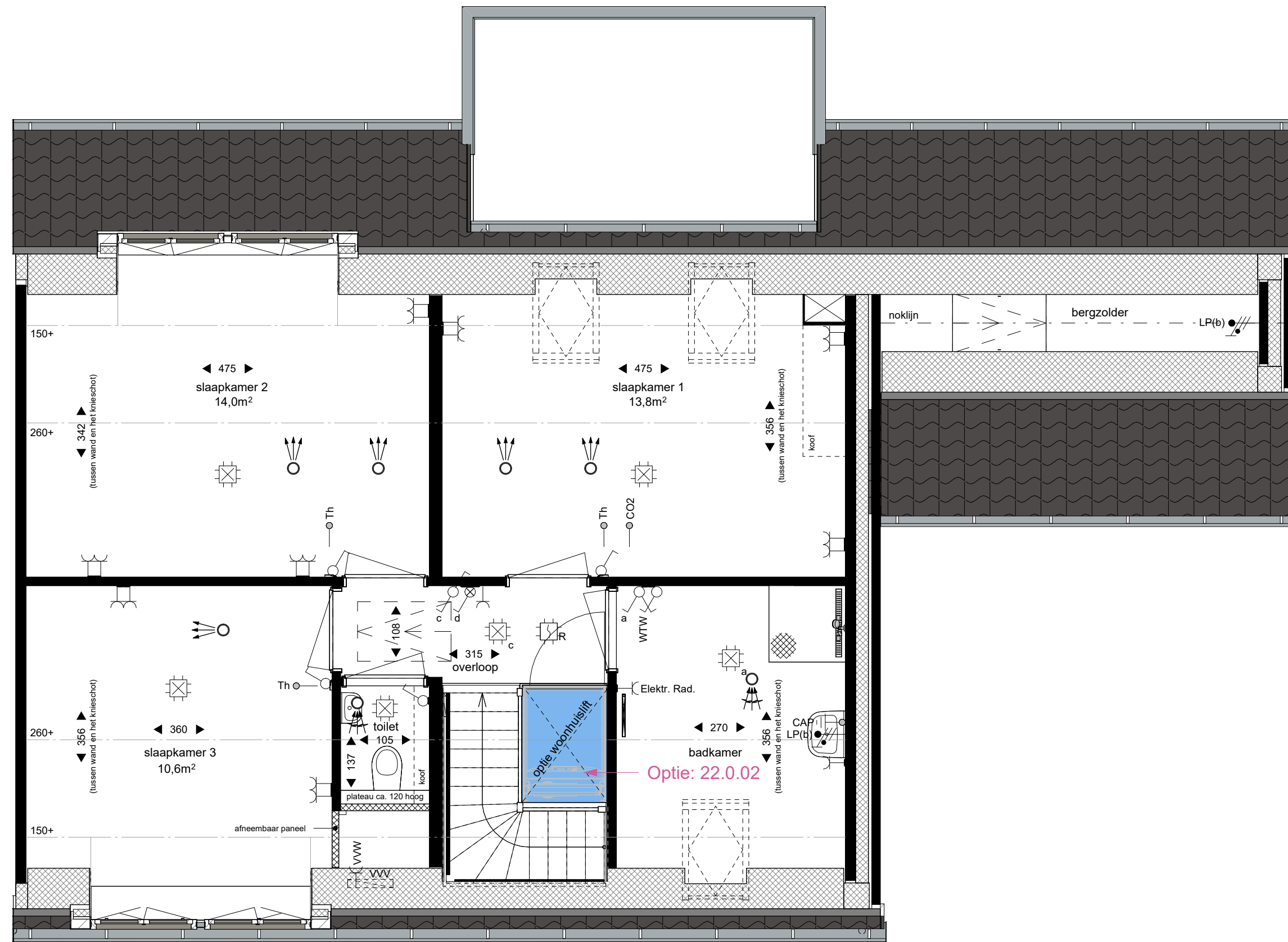
eerste verdieping optiemogelijkheden